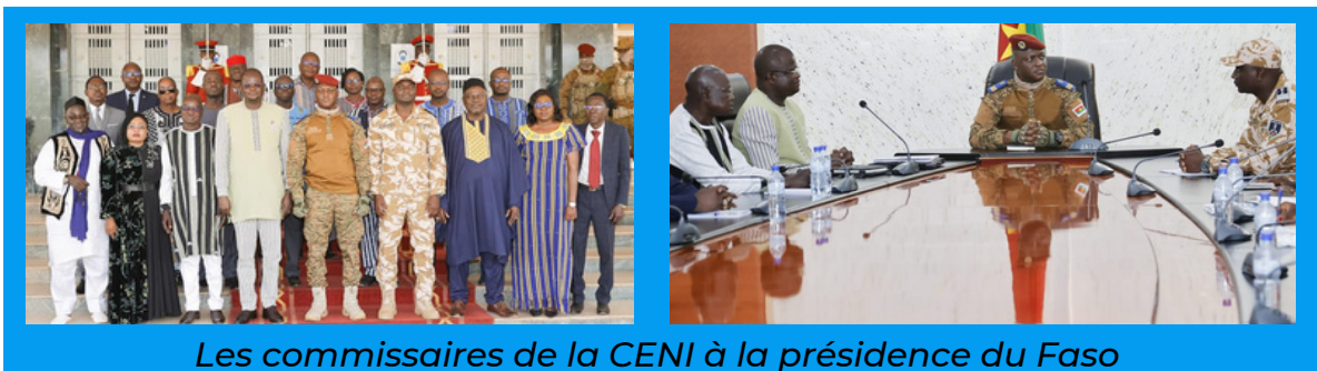
Les commissaires de la CENI à la présidence du Faso