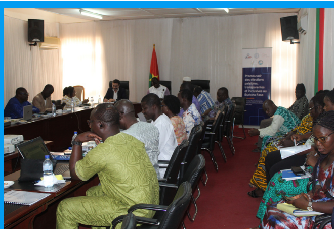
Cérémonie d'ouverture de l'atelier sur la validation d'outils opérationnels

Du 8 au 10 Février 2023, la Salle de conférence Moussa Michel TAPSOBA de la CENI, a abrité un atelier d'appropriation et de validation d'outils opérationnels et stratégiques. Des outils formulés dans l'optique de rendre plus professionnelle, l'administration de l'institution en charge de l'organisation des élections au Burkina Faso