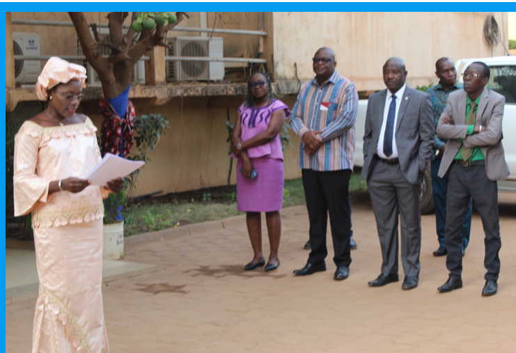
La secrétaire générale de la CENI lors de la lecture de son discours

La secrétaire générale de la Commission électorale nationale indépendante présente ses vœux à l'ensemble du personnel. La traditionnelle cérémonie s'est faite après une montée des couleurs haut en symbole dans l'enceinte de la CENI.