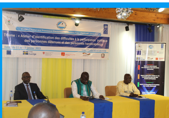
Vue des participants à l'atelier de Loumbila

Le droit de vote constitue l'un des mécanismes essentiels d'expression de la citoyenneté, protégé par l'article 25 du Pacte international des droits civils et politiques (PIDCP).