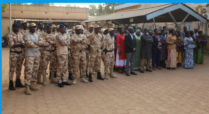
Le personnel de la CENI à la montée des couleurs

Pour ce faire, elle peut compter sur le Gouvernement de Transition mais aussi sur ses partenaires que sont IFES, ECES et le PNUD à travers le PAPE qui ont signifié leur accompagnement pour relever les défis qui se présentent désormais à la Commission. A la fin de son discours, la SG a remercié l'ensemble du personnel administratif et technique pour son engagement constant et souhaité que l'année 2023 soit porteuse de plus d'espoir pour tous.